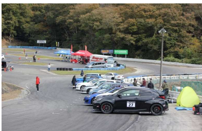
パドックはサーキットのコース内に設定