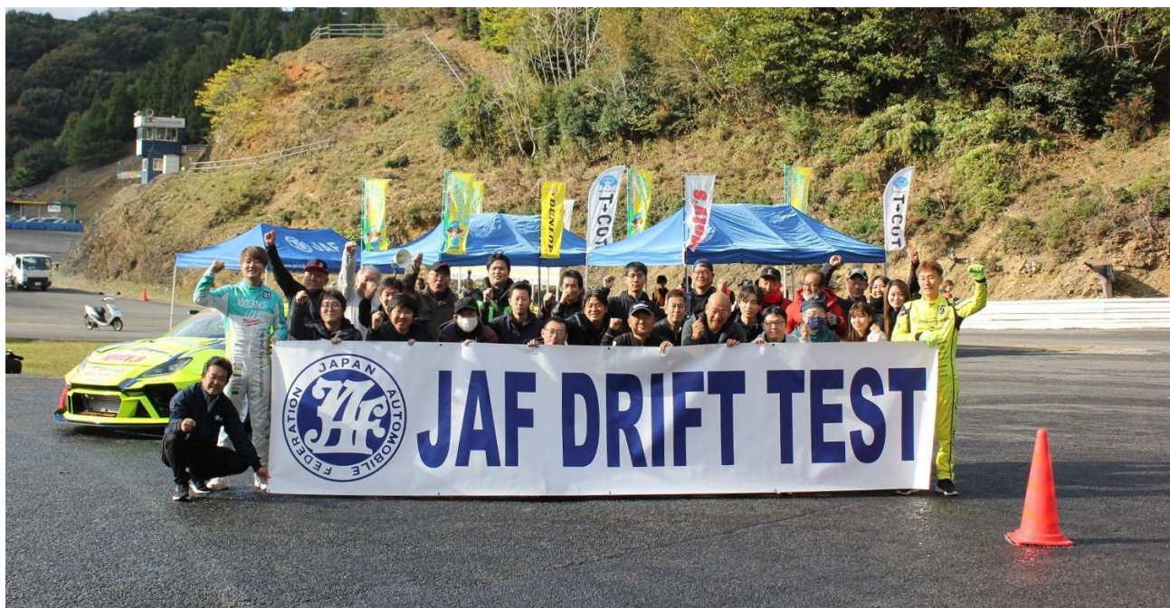
講師を交えての記念撮影