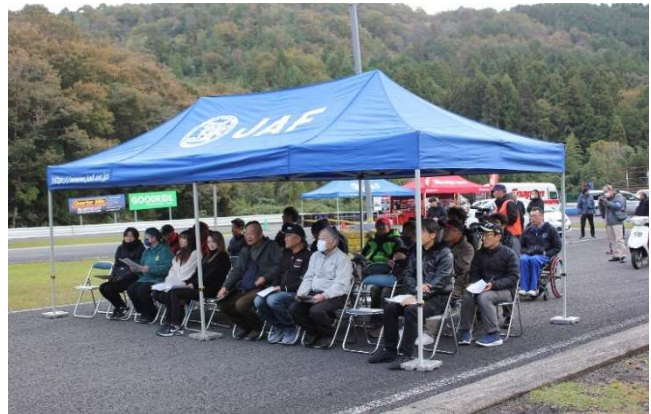
開会式・競技説明の状況