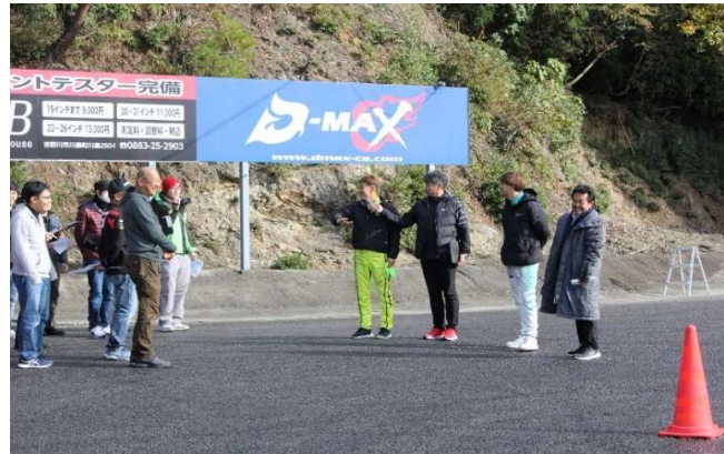
開会式の後はコースを歩きながら講習