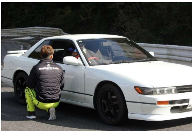
練習走行後は講師によるアドバイス