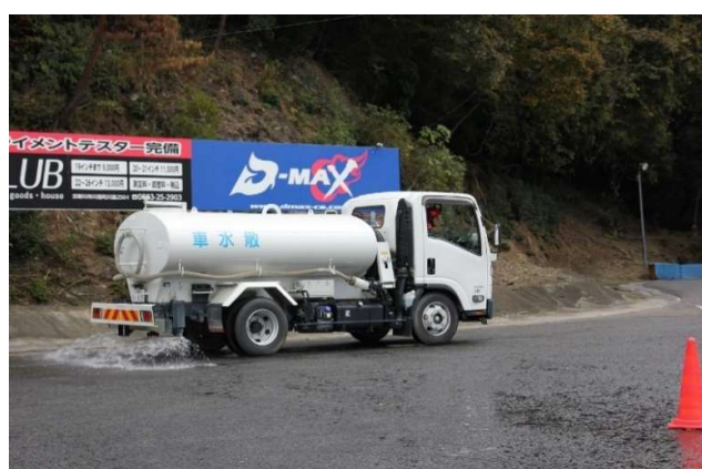
滑りやすい路面づくりのために散水