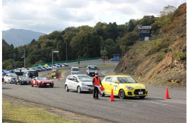
緊張のスタート待ち