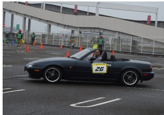
チャレンジクラス2位の多曾田選手