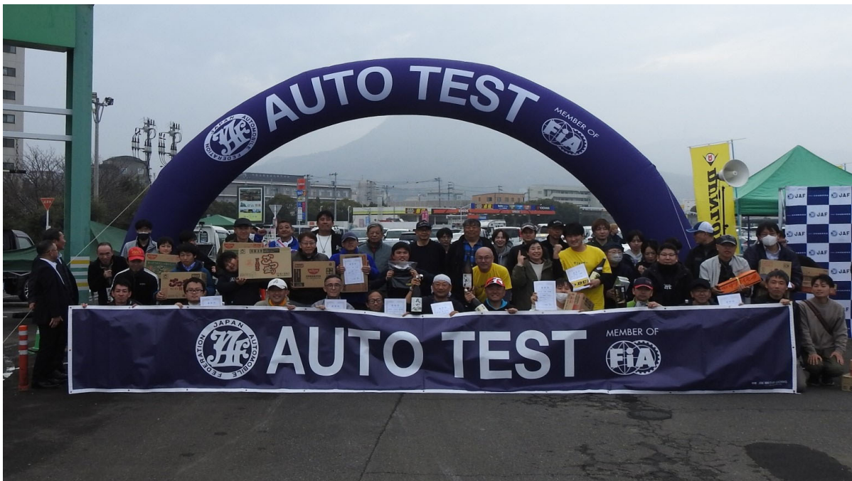
最後には参加選手全員で記念写真