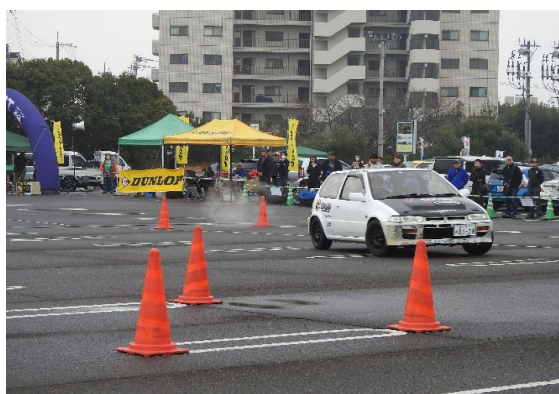
試走は四国ジムカーナチャンピオン