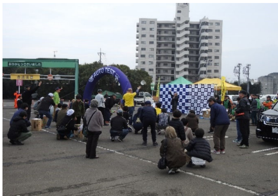
表彰式の後にはじゃんけん大会