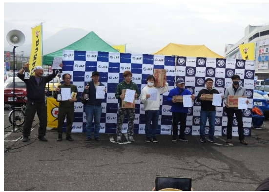
エキスパートクラス入賞者