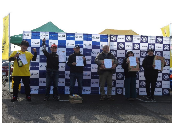
普通車クラス入賞者