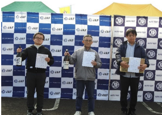
チャレンジクラス入賞者