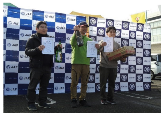
軽四クラス入賞者